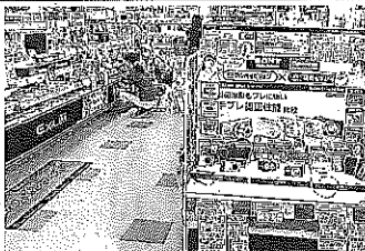
被災地ではデジタルカメラの販売が好調(宮城県の家電量販店売り場)

東日本大震災で被害の落ち込みが目立つが、被災地では生活復旧のため型とデスクトップ型を合わせた8月の販売台数は、3県以外の地域で前年同月比約1.6割増だった。8月はパソコンやデジタルカメラなど幅広い品目で販売台数が増え、家電販売店も約2000店が前年同月比約1.6割増となった。テレビ放送の地上デジタルへの移行後、他の地域では需要の増えで、最も販売が伸びている。